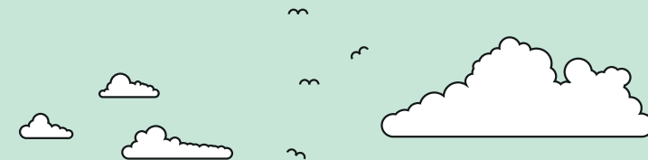
Illustration av Källberga skola, framtaget av Metropolis arkitekter för Hoivatilat