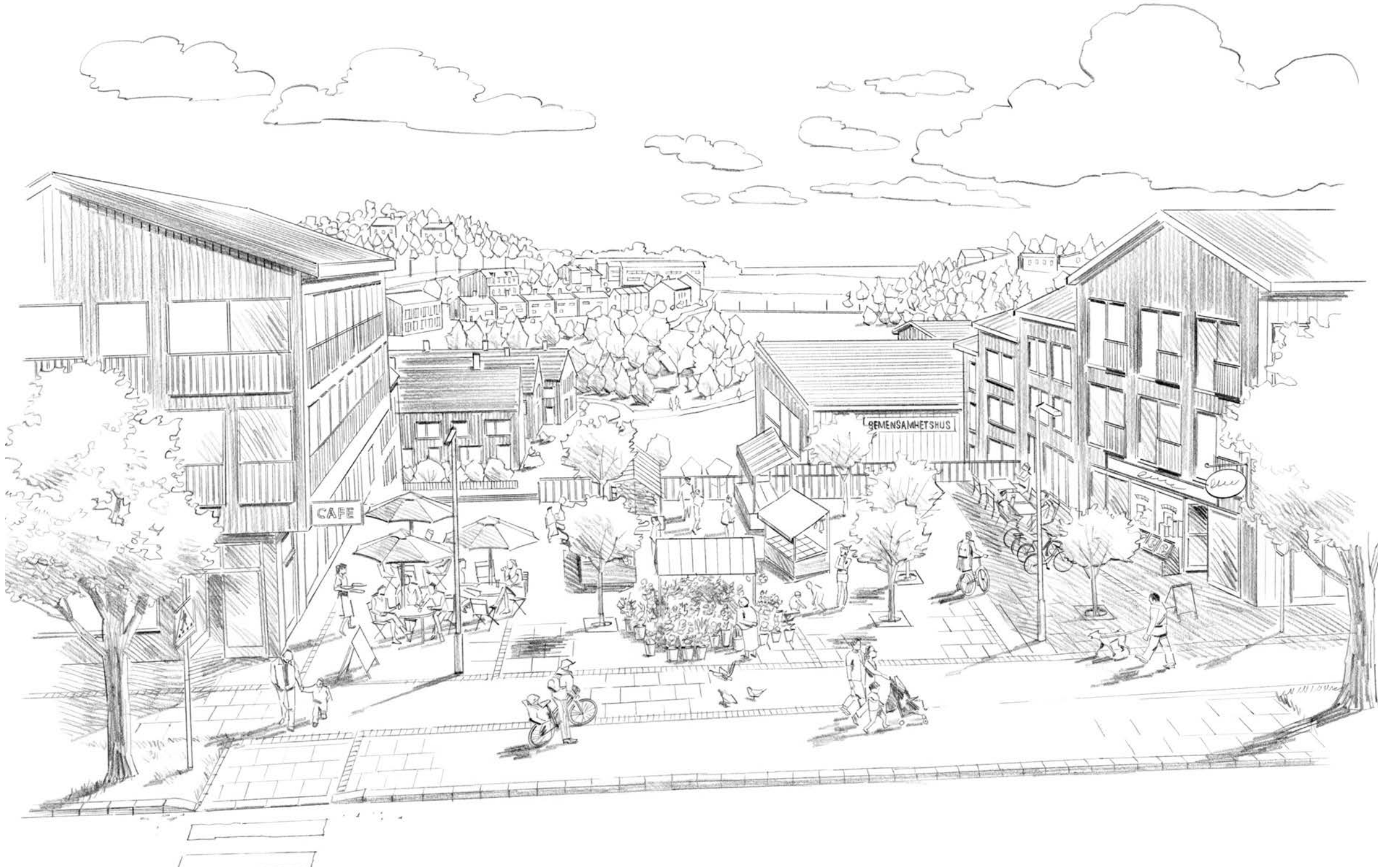
Vy mot den västra dalgången med torget i förgrunden.