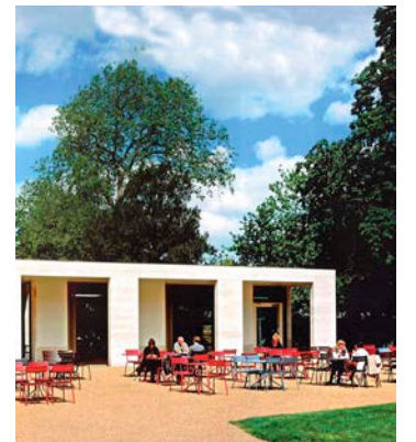
Arkitekt Caruso S:t John