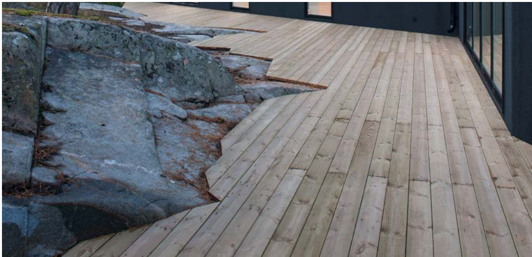
Källberga Ett naturnära boende med fokus på social och ekologisk hållbarhet.