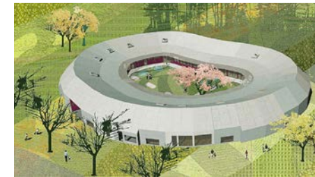
Ugglan, Botkyrka Exempel på förskola Arkitekt: 3do Arkitekter ab