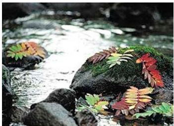
Naturen i Källberga är spännande och omväxlande. När området bebyggs bereds också en plats för urban grönska, dagvattenpark och odlingslotter.